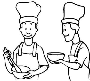
Maßeinheit ist ein

nocheinmal bei ___ 1.Mose 8:3 Grad, ca. 30-45 Minuten backen.